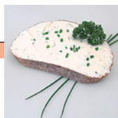
Frischkäse auf Brot